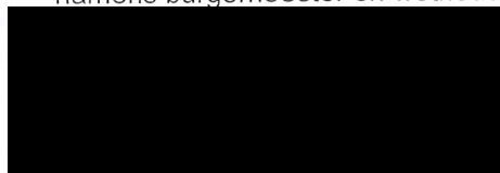
Jaap Velema burgemeester

Met vriendelijke groet, namens burgemeester en wethouders,